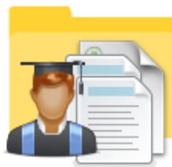
FA Academic Progress

Oprima la carpeta de “FA Academic Progress” .