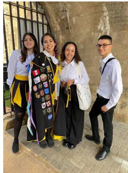
Grupo de Teatro Histriones