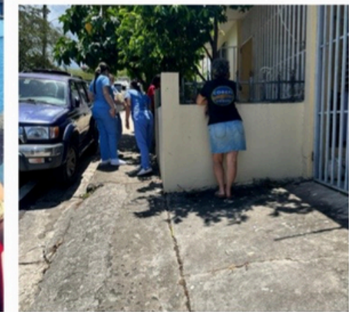
Labor Comunitaria Vieques