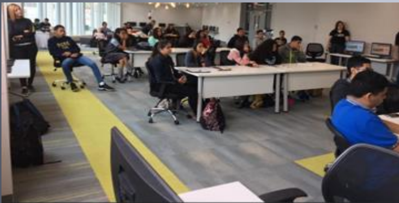
ADEM UPRA en Escuela De Bellas Artes Adrián Santos Tirado