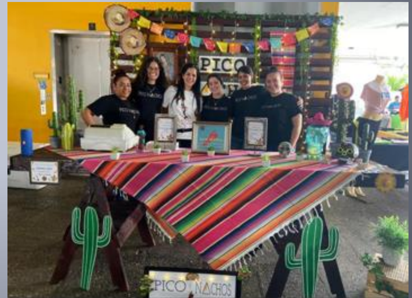
Estudiantes ADMI 3100