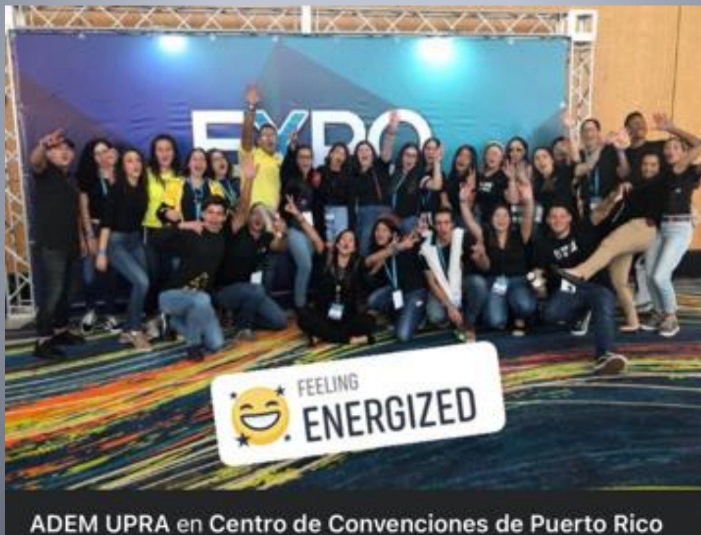
ADEM UPRA en Centro de Convenciones de Puerto Rico