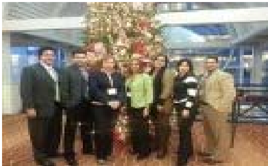
Foto de: Directores de Planificación de las Unidades de UPR-Bayamón, UPR-Utuado, UPR-Ponce, Administración Central, UPR-Arecibo y UPR-Aguadilla en la Conferencia Anual de MSCHE.

Más información: www.acreditación.blogs.upra.edu