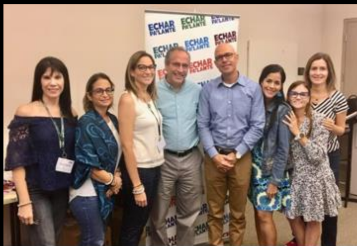
ADEM UPRA en Centro de Desarrollo, Banco Popular, @ Centro Europa, Santurce