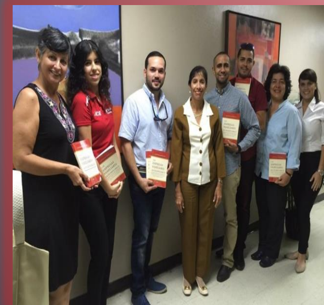
Actividad con egresados de UPRA- y Presentación de Libro