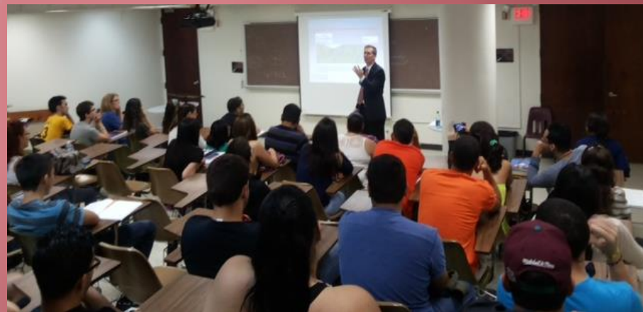
Taller: Innovaciones en las Finanzas